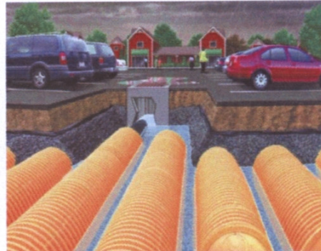
KOMORY DRENAŻOWE SKUTECZNE I WYTRZYMAŁE PODZIEMNE SYSTEMY DO WÓD DESZCZOWYCH