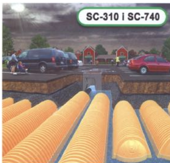
SC-310 | SC-740