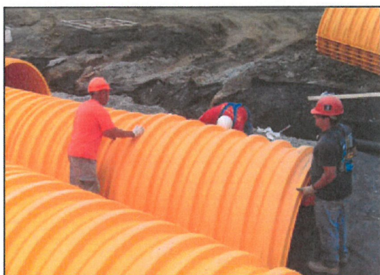
5. Dwie sąsiednie komory powinny być połączone na zakładkę