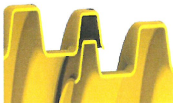
Łączenie komór na zakładkę