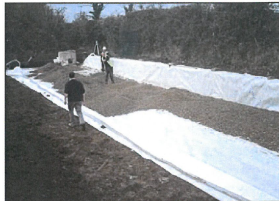
2. Na dnie umieszczamy warstwę minimum 23 cm obsypki z tłucznia (uziarnienie 31-63 mm)