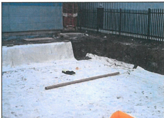
1. Wykonujemy wykop, a następnie wykładamy wykop geowłókniną