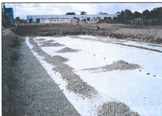
7. Układamy geowłókniną, a nad nią wykonujemy zasypkę, którą zagęszczamy co 15 cm