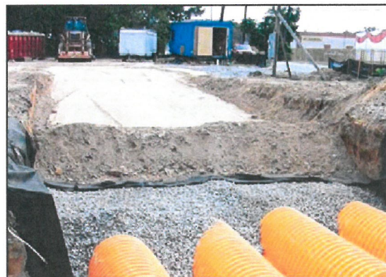
8. Warstwy systemu