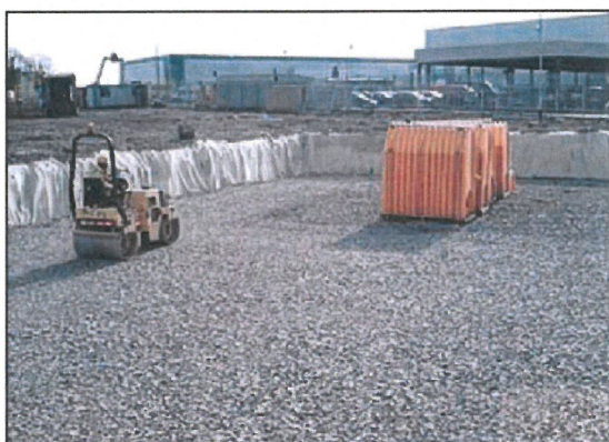
3. Tłuczeń zgęszczamy do min. 95% gęstości standardowej Proctora