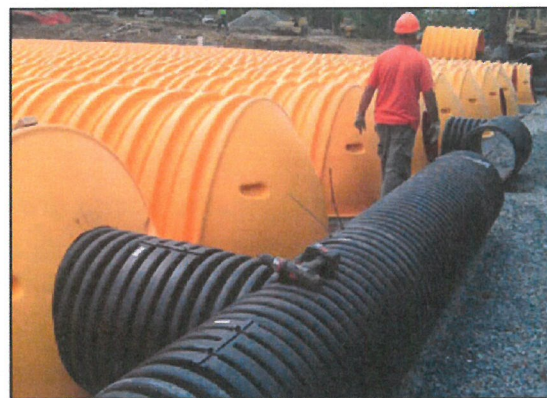
4. Układamy ciągi komór drenazowych (odstęp między rzędami minimum 15 cm)