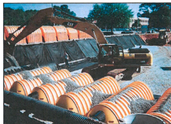
6. Przykrycie systemu wykonujemy za pomocą obsypki z tłucznia