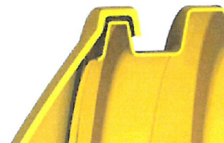
Montaż pokrywy skrajnej na zakładkę