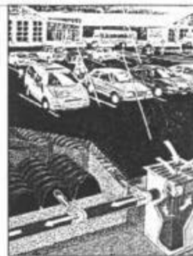
Rys. 1. Schemat idealowy zastosowania komór drenażowych na parkingu

Publikujemy dalszy ciąg artykułu z nr 6/06 MA na temat retencjonowania i odprowadzania wód opadowych z powierzchni dróg, ulic i parkingów przy wykorzystaniu skrzynek i komór drenażowych. W aktualnym wydaniu autorzy omawiają zagadnienie projektowania systemu komór drenażowych oraz zastosowanie komór i skrzynek drenażowych w budownictwie drogowym.