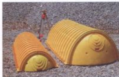
Komora drenażowa rozszczajająca SC-310 i SC-740

Oprogramowanie: rysunki i podręcznik projektowania dostępne w internecie lub w formie broszury i płyty CD