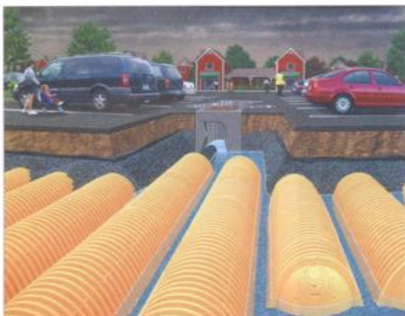
Komory drenażowe rozszczajające SC-310 i SC-740

komory drenażowe rozszczajające typ SC-310 i SC-740