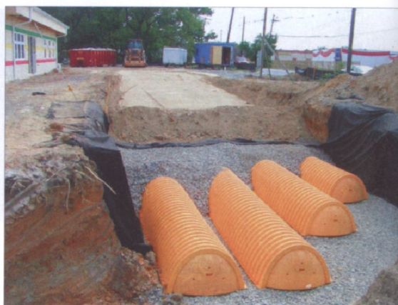
Komory drenażowe SC-310 i SC-740